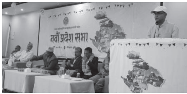
सुर्खेत समाचारदाता सुर्खेत, चैत २३ गते