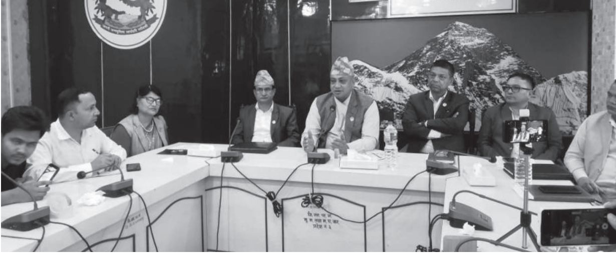
मुख्यमन्त्री तथा मन्त्रीपरिषद्को कार्यालयमा आयोजना गरिएको कार्यक्रम।